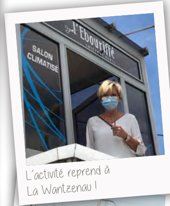
L'activité reprend à La Wantzenau !