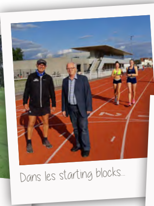
Dans les starting blocks...