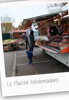
Le Marché hebdomadaire