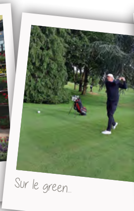
Sur le green...