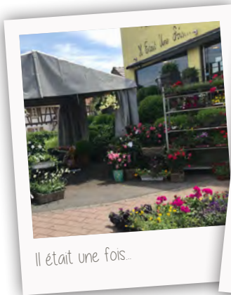
Il était une fois...

Ci-après quelques images encourageantes des premiers pas vers une « semi-liberté » ! Quelques associations témoignent . Pour le prochain numéro, associations, commerçants, entreprises , restaurateurs... N'hésitez pas à nous envoyer votre témoignage !