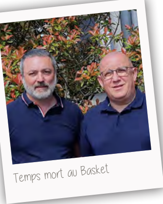
Temps mort au Basket