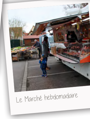
Le Marché hebdomadaire